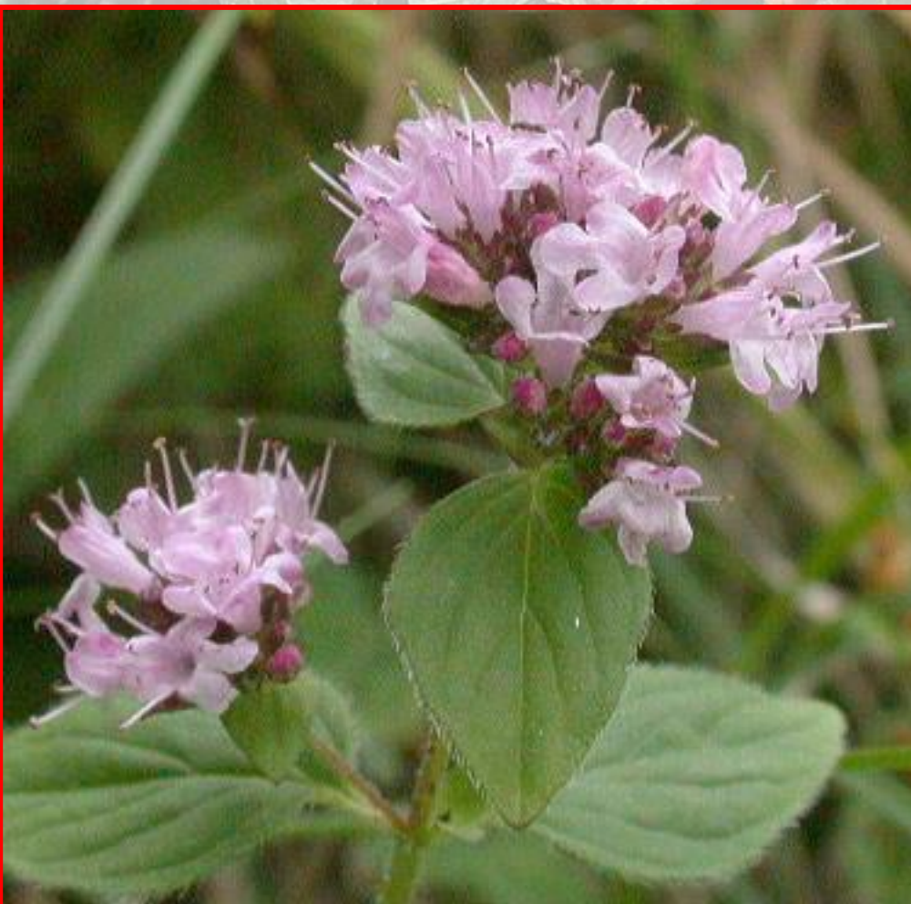
Origanum vulgare – vranilova trava, planinski čaj