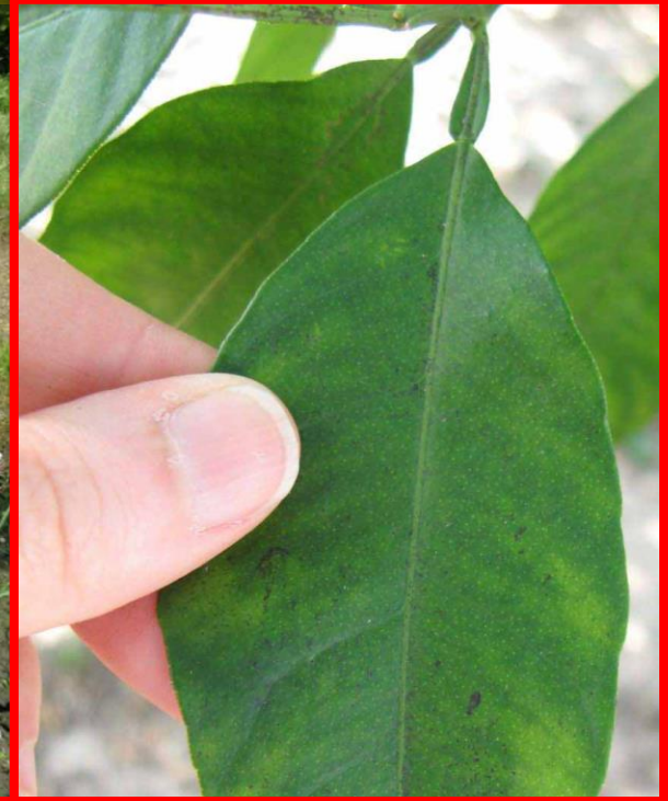
Dictamnus albus - jaseňak