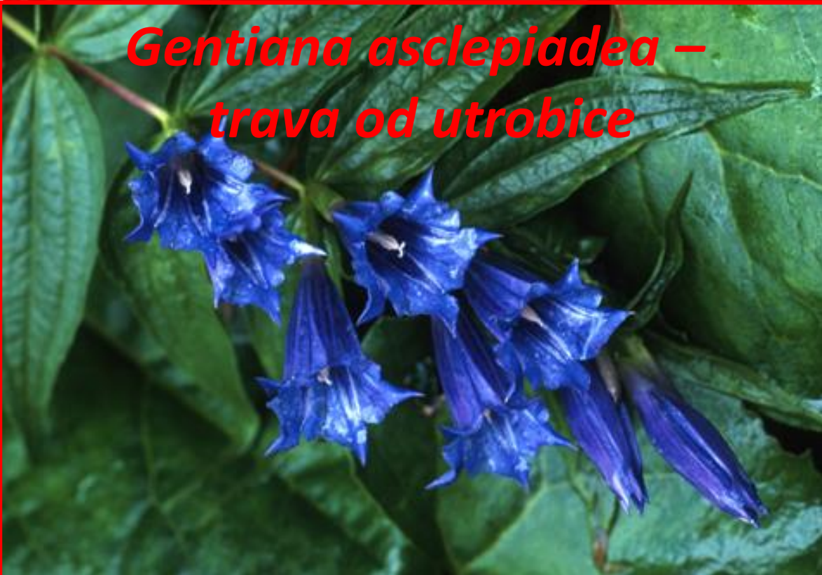
Gentiana asclepiadea – trava od utrobice