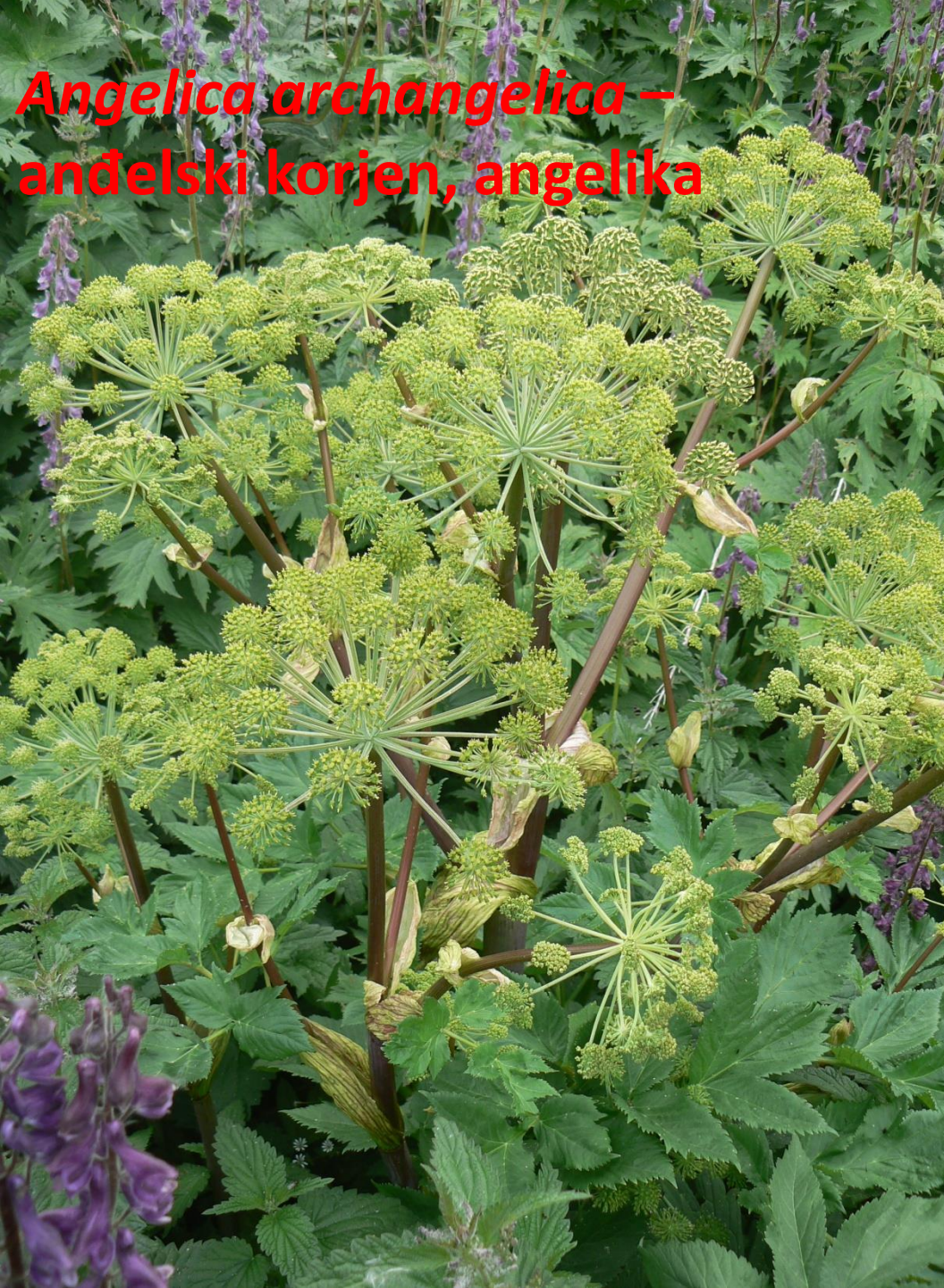
Angelica archangelica – andelski korjen, angelika