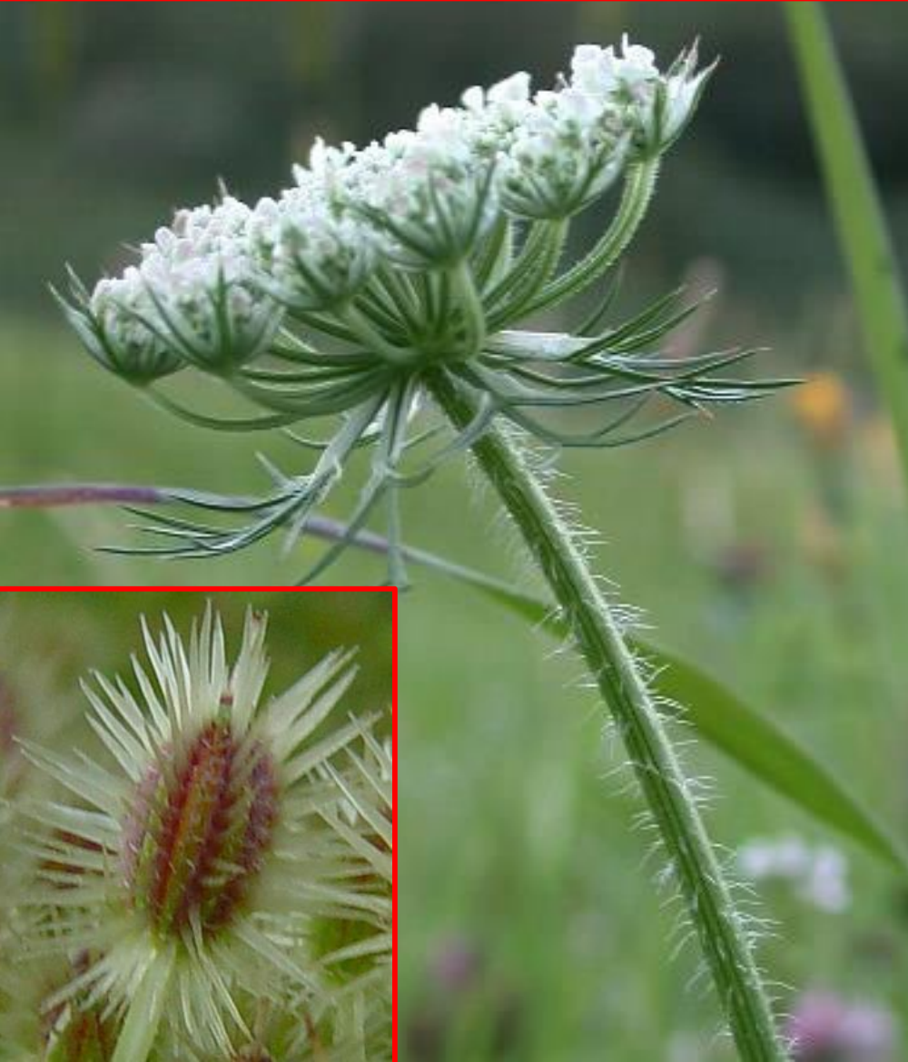
Daucus carota – mrkva, šargarepa