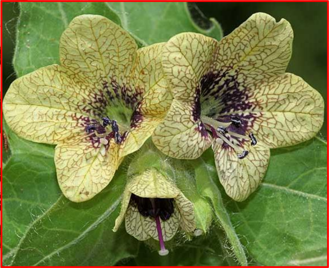
Hyoscyamus niger - bunika