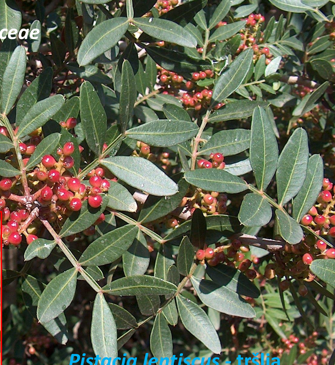
Pistacia lentiscus - tršlia