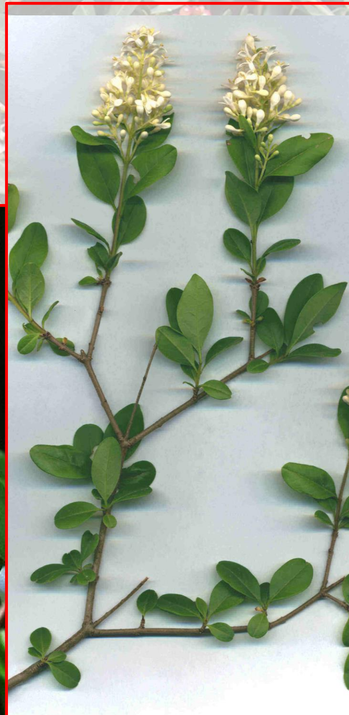
Ligustrum vulgare - kalina