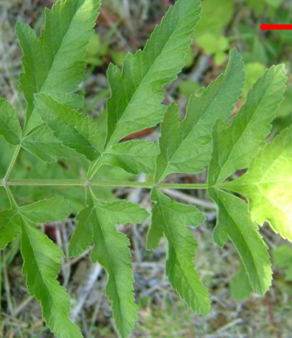
Pastinaca sativa - paškanat