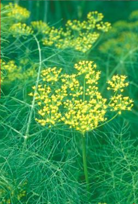
Foeniculum vulgare - móráč