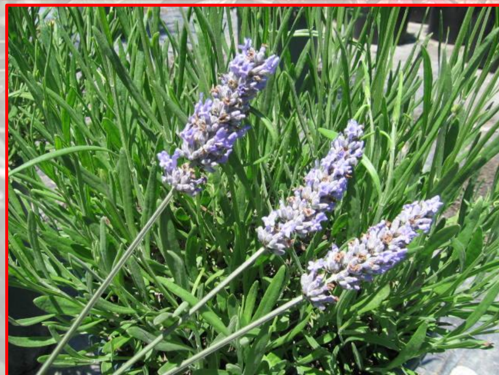
Lavandula angustifolia - lavanda