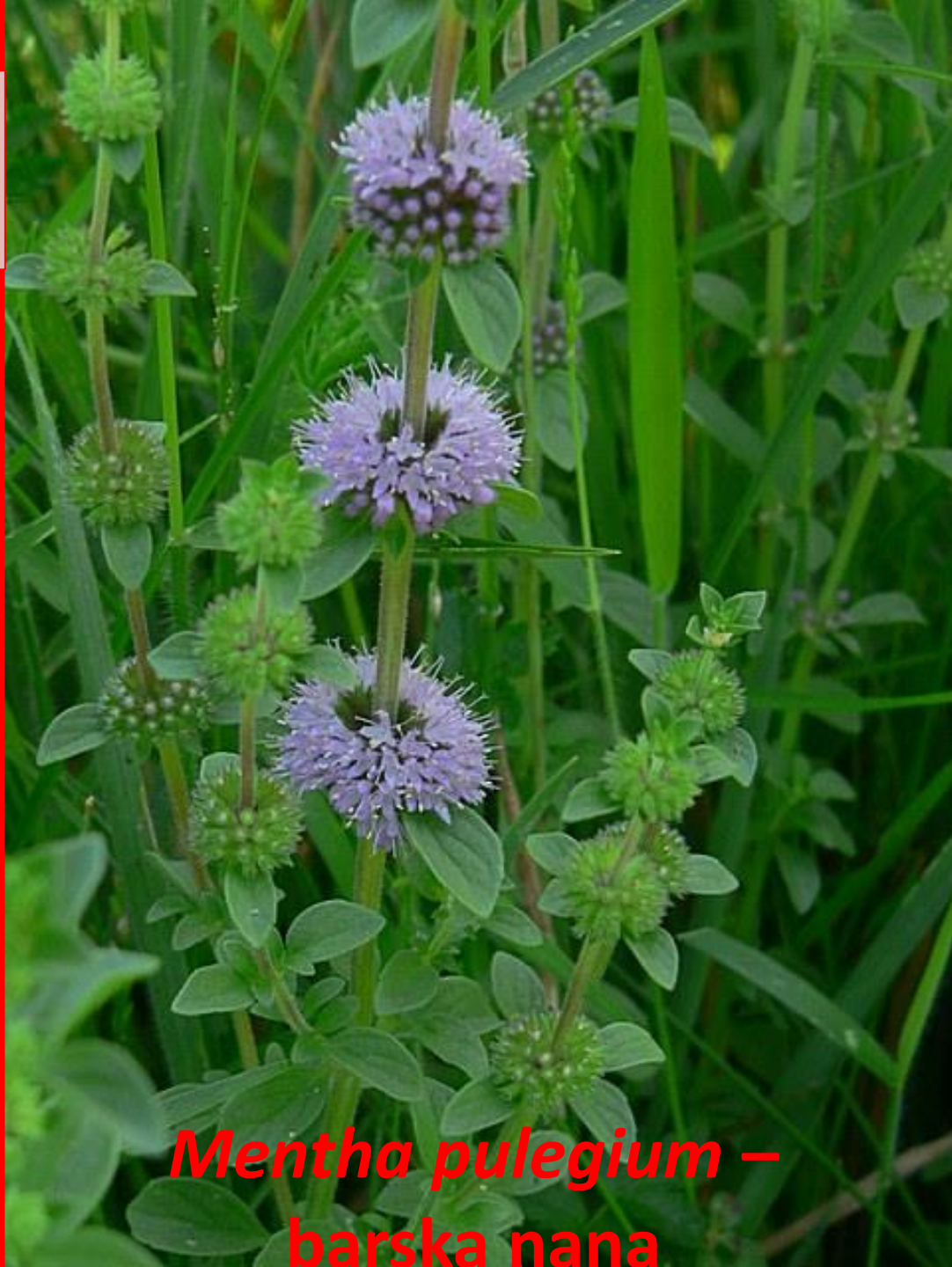
Mentha pulegium – barska nana