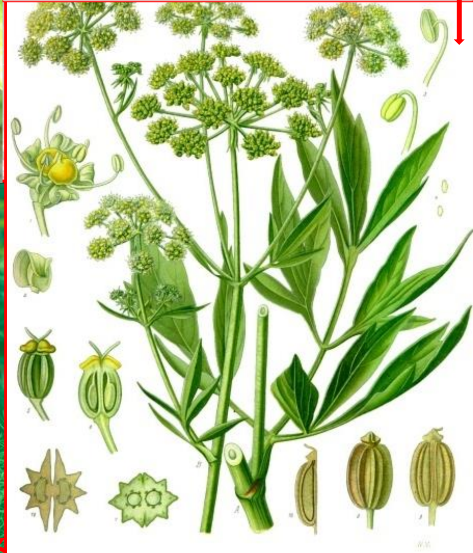
Levisticum officinale - selen