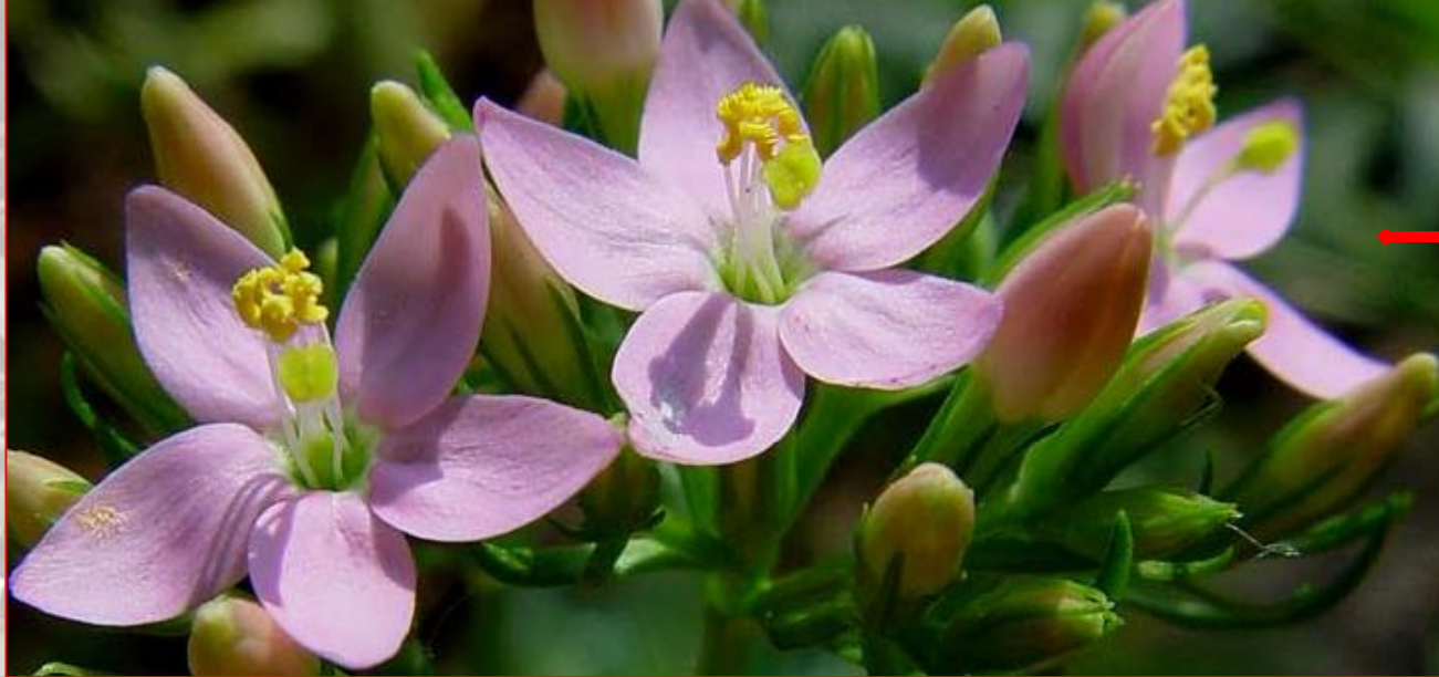
Centaurium umbellatum - kičica