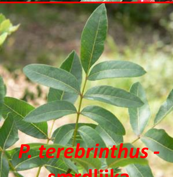
P. terebinthus - smrdlička