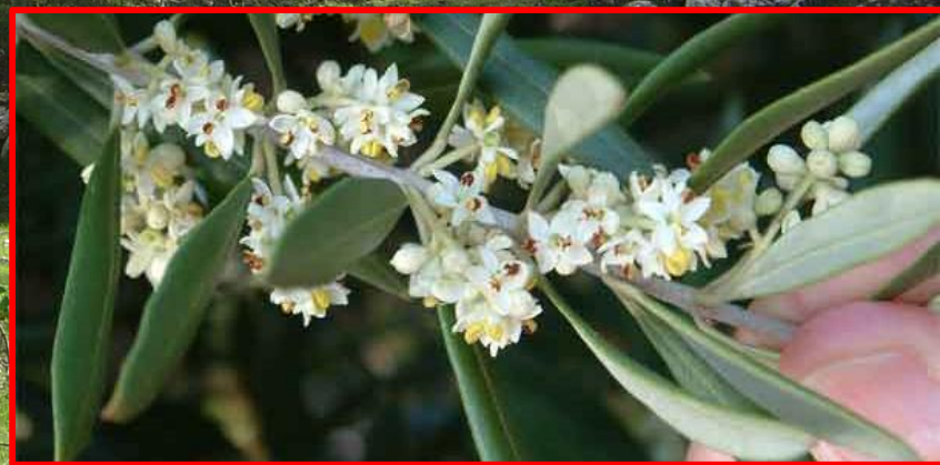
Olea europaea - maslina